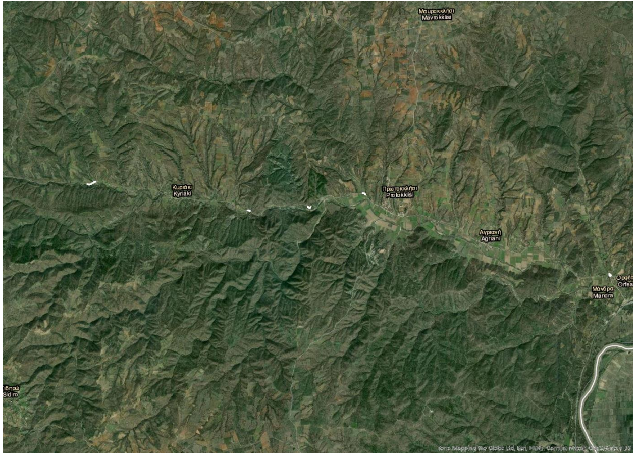
Εικόνα 1: Θέσεις επεμβάσεων στον άξονα Μάνδρα-Κυριακή

Στον άξονα Μικρό Δέριο – Χίλια προτείνεται να γίνει διαπλάτυνση σε 41 θέσεις. Ιδιαίτερα στον άξονα Ρούσσα-ΑΣΠΗΕ Πατριάρχης, οι επεμβάσεις είναι πολλές και διαδοχικές, ενώ θα απέχουν μεταξύ τους λιγότερο από 500μ σε ευθεία (εικόνες 2, 3).