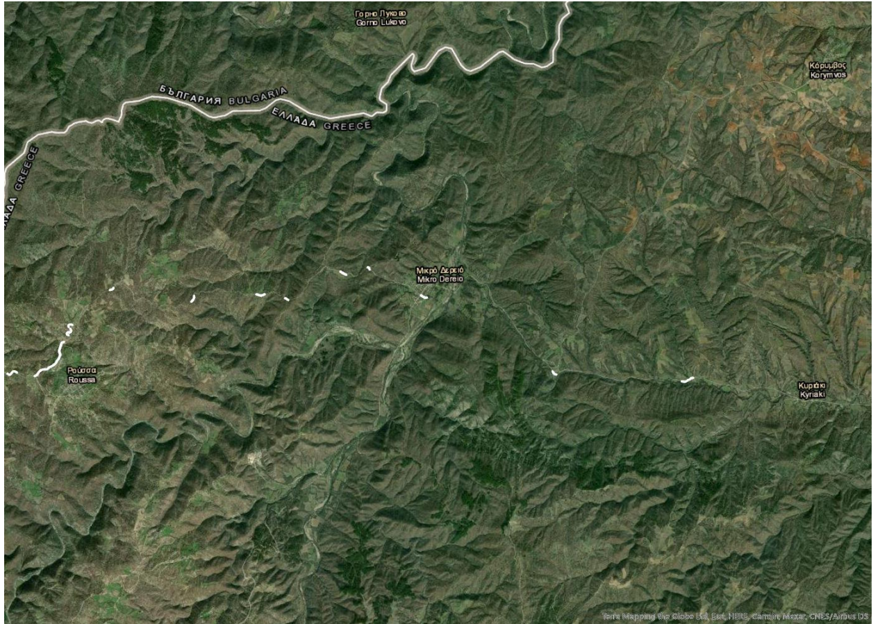
Εικόνα 2: Θέσεις επεμβάσεων στον άξονα Κυριακή-Ρούσσα